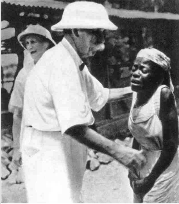
In tiefer Sorge um den Patienten

Seit dem Jahre 1913 arbeitet Albert Schweitzer als Arzt im Urwald. Eine große Wellblechbaracke ist der Operationsraum. Daneben stehen viele Bambushütten und Holzhäuser. Das ist das Urwaldkrankenhaus von Lambarene.