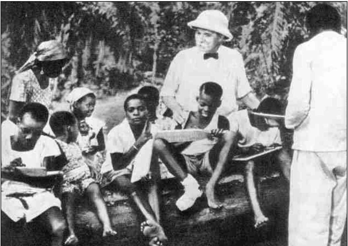
Bei einer Unterrichtsstunde im Urwaldspital

Diesen kranken Menschen hilft Dr. Albert Schweitzer. Er muss operieren, Wunden verbinden, Spritzen geben und manche Heilmittel selbst herstellen und mischen.