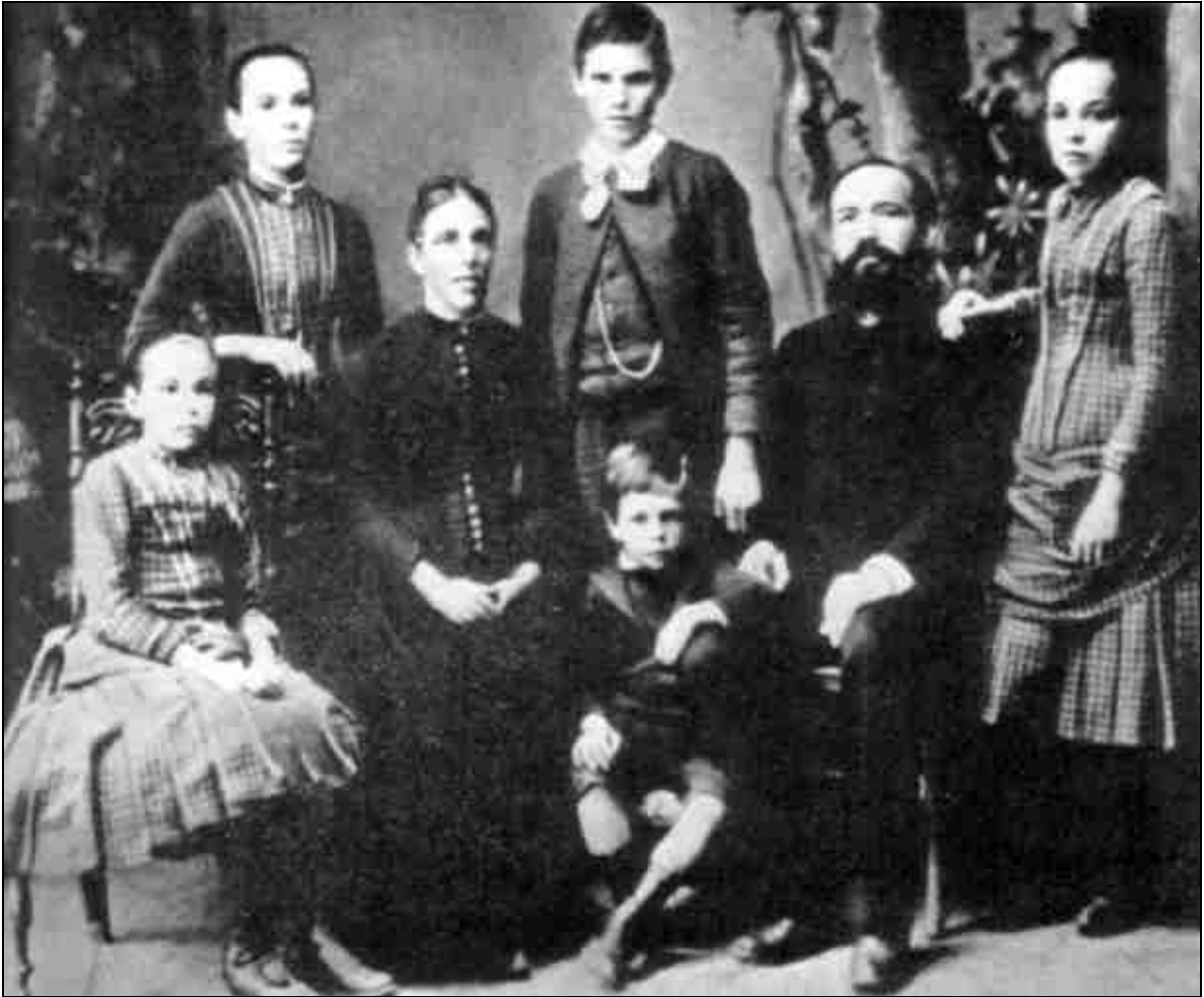
Familie Schweitzer in den achtziger Jahren. Albert Schweitzer zwischen seinen Eltern stehend.